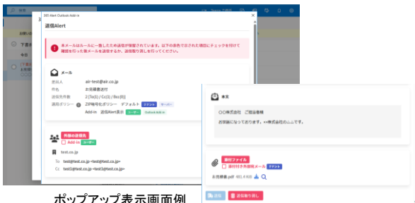
ポップアップ表示画面例